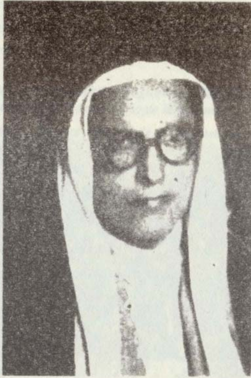
عبدالله القصيمي (الصورة: الحرية، بيروت ٢١ يناير ١٩٥٦)